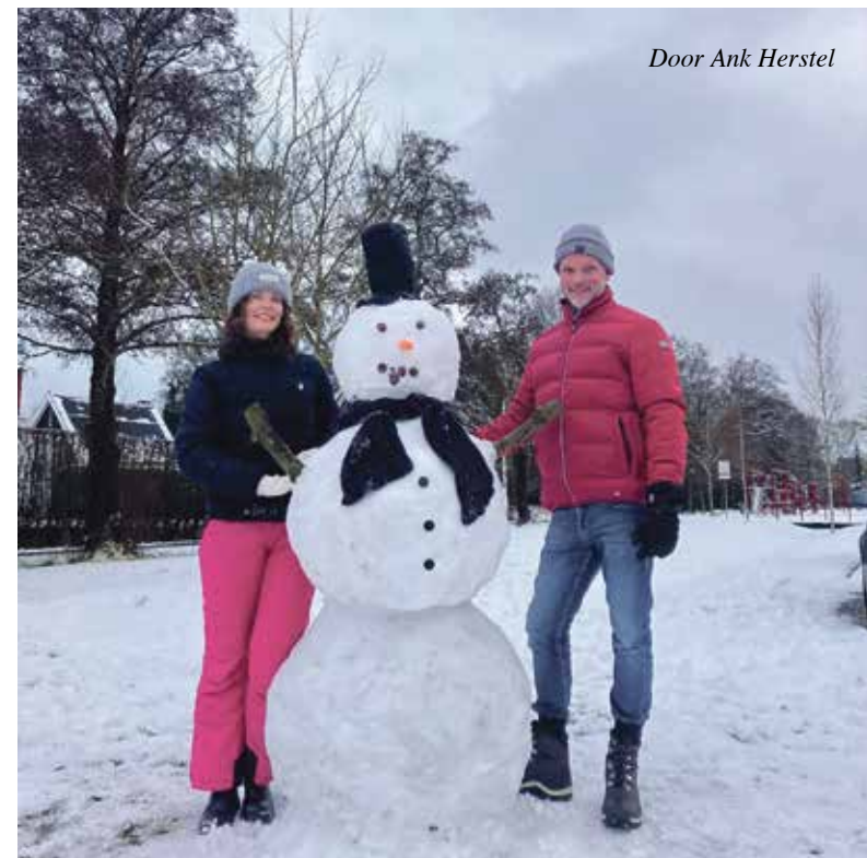
Door Ank Herstel