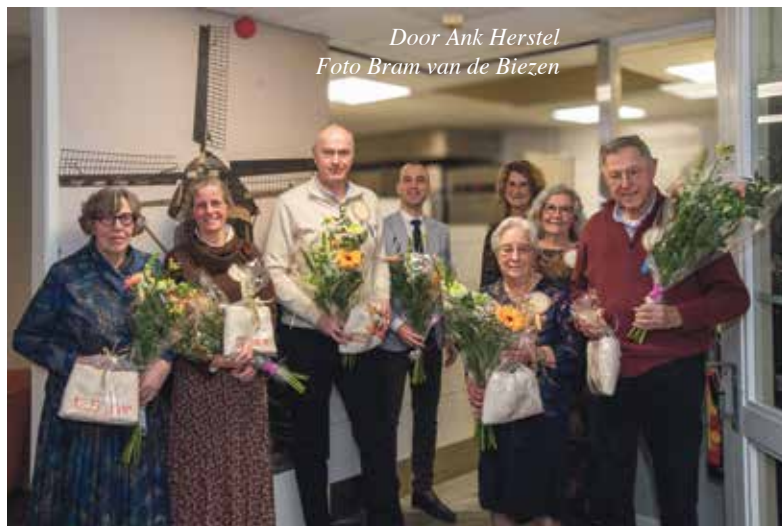
Door Ank Herstel

Een vraag die simpel klinkt, maar volgens Martin veel zegt over het dagelijkse werk van Oranjehof. “Wij