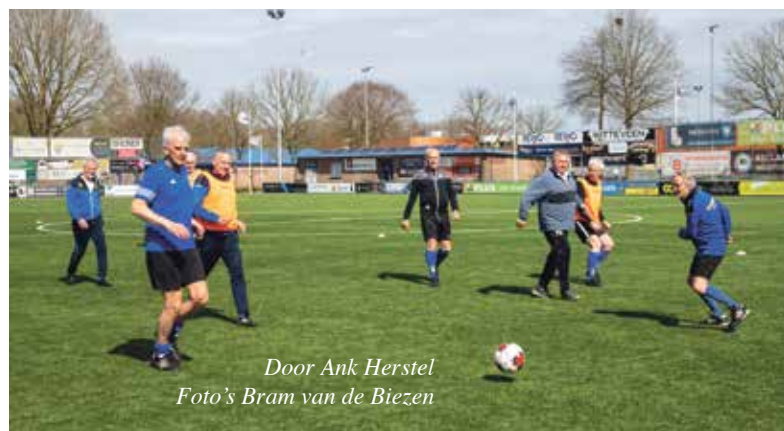
Door Ank Herstel

NUNSPEET – Op het eerste gezicht lijkt het op een rustig potje voetbal, maar schijn bedriegt. Wie een training van het Walking Voetbal bij VV Nunspeet bezoekt, ziet fanatieke zestigplussers die zich even zo fanatiek in het zweet werken, al mogen ze absoluut niet rennen.