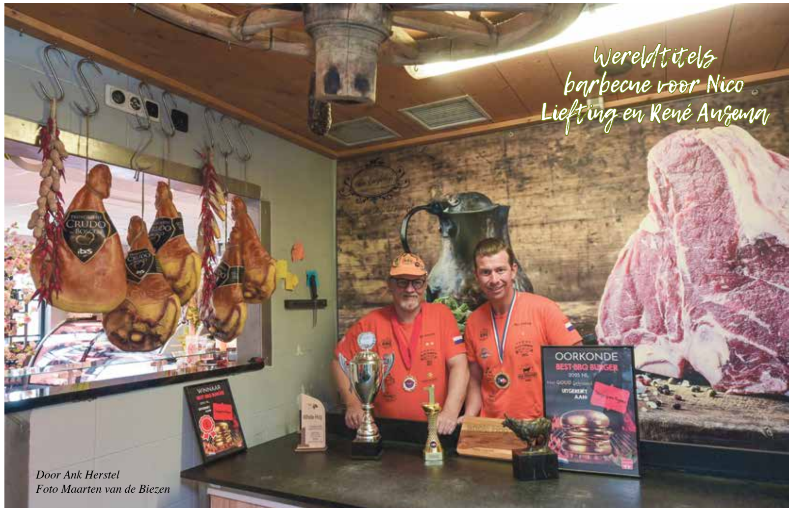
Door Ank Herstel

Dat was ook nodig, want veel spullen mochten ze niet meenemen. Ingredienten, sauzen en zelfs messen bleven