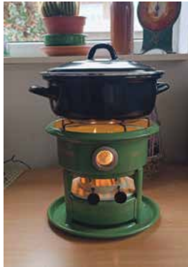
Daardoor verbruikt een slowcooker verrassend weinig energie, vaak niet

meer dan een ouderwetse gloeilamp. Bovendien hoeft je niet continu het fornuis aan te hebben. Stoofpotjes, soepen en sauzen worden er heerlijk mals van, terwijl je er nauwelijks omkijken naar hebt. Even 's ochtends aanzetten en aan het eind van de dag staat er een warme maaltijd klaar.