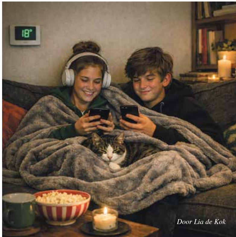
Door Lia de Kok

Ook in de keuken valt veel te besparen. Steeds meer mensen ontdekken de slowcooker. Dit apparaat gaart gerechten langzaam op lage temperatuur, meestal tussen de 70 en 90 graden.