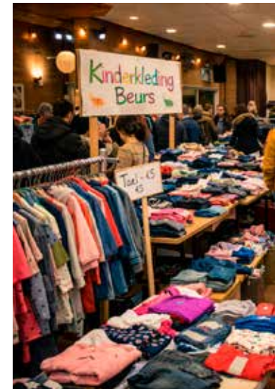
hof aan de Colijnstraat 78 in Nunspeet

NUNSPEET – Op vrijdag avond 10 april wordt er bij WOC de Binnenhof een tweedehands kinderkledingmarkt gehouden. Ruim 60 verkopers zullen hun mooie kinderkleding aanbieden tegen kleine prijsjes. Behalve dat het gezellig is om op deze manier in het WOC te shoppen, is het ook nog eens goed voor de portemonnee en wordt op deze manier bijgedragen aan een manier van duurzaam leven. Neem de kinderen mee zodat ze zelf iets leuks uit kunnen zoeken en je hebt er geen kind meer aan! Zelf kleding verkopen kan natuurlijk ook. Het is mogelijk om een tafel of een rek te huren. Stuur dan een mail naar kkmnunspeet@hotmail.com voor alle informatie. De kinderkledingbeurs wordt gehouden van 19.00 tot 21.00 uur in WOC de Binnen-