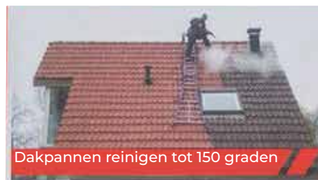
Dakpannen reinigen tot 150 graden