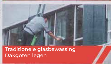
Traditionele glasbewassing Dakgoten legen