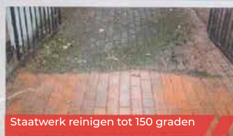
Staatwerk reinigen tot 150 graden