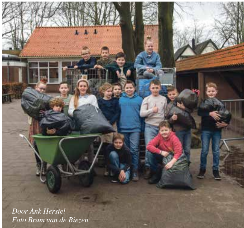
Door Ank Herstel

Maar dit is niet zomaar een wedstrijd..... het is een missie om de wereld een beetje beter te maken. Femke, Jan en Job zijn de woordvoerders van groep 7. Zij vertellen dolenthousiast wat er tijdens de Textielrace allemaal op hun school gebeurt. Het begon met een gastles. Een mevrouw kwam langs en vertelde over de verborgen wereld achter hun kleding. Femke vertelde verbaasd te zijn toen ze hoorde dat sommige kleding zelfs door kinderen in fabrieken wordt geproduceerd hoorde hoeveel water er nodig is om katoen te maken. "Dat is echt zonde," zei ze vastberaden. "Daarom gaan wij kleding hergebruiken en minder nieuw kopen!" Groep 7 is inmiddels fanatiek aan de slag gegaan om plannen te maken om zoveel mogelijk textiel in te zamelen én om punten te verzamelen. "We verzamelen kleding, gordijnen en ander textiel," vertelt Femke trots. "En volgende